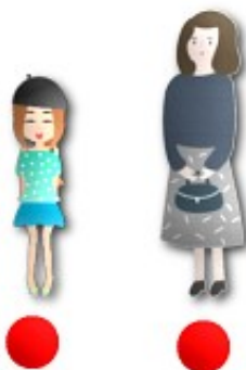
2.- Chica baja