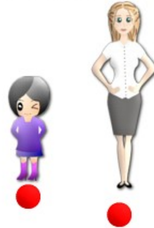
3.- La más alta.