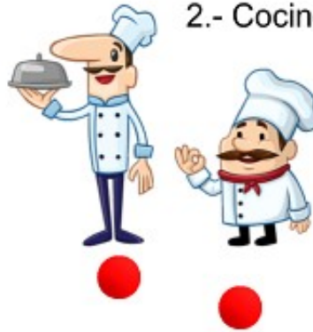
2.- Cocinero bajo.