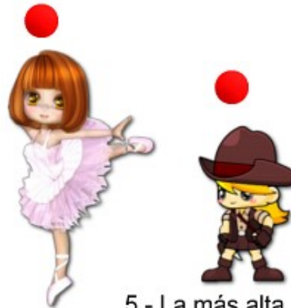
5.- La más alta.