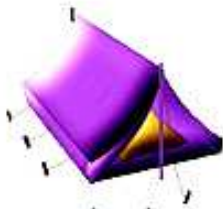
caseta de campana